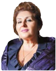
Мария САФАРЬЯНЦ, заслуженная артистка России, организатор музыкального фестиваля «Дворцы Санкт- Петербурга»