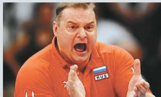
Алекно уже дал понять: многое придется начинать с нуля и для возвращения на былые позиции предстоит серьезно и тяжело работать.

оправдания. В частности, дал понять, что после напряженного клубного сезона времени для полноценной подготовки и восстановления волейболистов сборной не хватило. Но не только в «физике» было дело – игроки действовали на площадке с какой-то апатией, что породило разговоры о потере главным тренером контроля над командой. Тем более, в отличие от эмоционального и чрезвычайно энергичного Алекно, встряхнуть подопечных наставнику никак не удавалось. И не удалось.